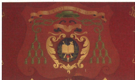
Le blason des missionnaires diocésains

Sur notre commune, l'Association Sportive d'École-Valentin a recruté, dans son activité « marche », cinq volontaires bénévoles qui sont chargés de vérifier la présence des balises, leur visibilité, la sécurité des chemins et d'avertir les autorités (commune, département) en cas de nécessité. Ce travail est renouvelé chaque année et plus si nécessaire. Le baliseur a reçu une formation et est adhérent d'un club de randonnée affilié à la Fédération Française de la Randonnée Pédestre (FFRP). Le balisage indique les changements et confirme la direction tous les 300 mètres. Il y a différents types de sentier de randonnée : les GR (Grande Randonnée), comme le GR 20 (Corse) et le GR 59 dans notre région qui sont balisés blanc et rouge. Les chemins de Compostelle, la Via Francigena sont signalés par un coquillage ou un pèlerin. Les GRP (Grande Randonnée de Pays), comme la ceinture de Besançon qui traverse notre commune, sont balisés en jaune et rouge. Les PR (Promenades et Randonnées) sont balisés en jaune (bois de Chailluz) ou jaune et bleu (bois des Tilleroyes). Le balisage des GR et GRP est réalisé par la FFRP via son comité départemental CDRP 25. En accord avec la nature, le baliseur hiberne pour cause de pluie mais ressort au printemps. Si le sentier est renseigné, le promeneur averti n'a plus qu'à suivre les balises. Bonne promenade ! ■ Robert Cosme