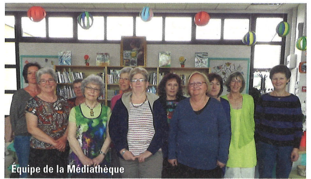
Équipe de la Médiathèque

C'est sur ce thème que la médiathèque municipale Jean Moulin a ouvert ses portes le 30 mai dernier. Cette journée dont l'objectif principal est la vente de livres d'occasion à des prix très modiques a donné lieu également à une exposition des œuvres des peintres professionnels et amateurs de la commune. Des ateliers et animations destinés tant aux adultes qu'aux enfants ont permis aux visiteurs de s'initier en particulier au travail de la céramique, origamis, dessins et peinture. Une exposition très originale de gravures et de créations de livres et ouvrages sur les contes a suscité un vif intérêt de la part des petits et des grands. La médiathèque compte 1 685 adhérents et propose plus de