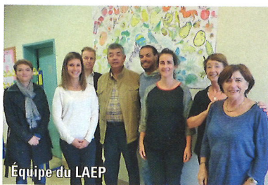
l'Équipe du LAEP