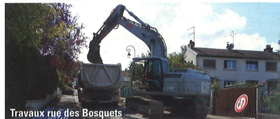
Travaux rue des Bosquets