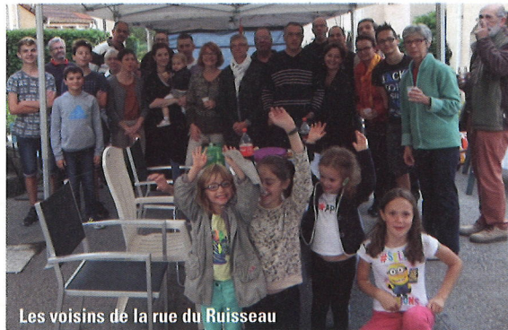
Les voisins de la rue du Ruisseau

Pour cette 16 e édition, plusieurs groupes de voisins se sont retrouvés, pas obligatoirement le 29 mai, mais en retenant une date qui convienne au plus grand nombre. Les habitants des rues des Chênes, du Vert bois, des Fauvettes, des Charmes, entre autres, se sont rassemblés... Ceux de la rue de la Prairie, après avoir festoyé, ont improvisé un concert de guitare. Cette année, pour la première fois, les habitants du nouveau quartier de la Combe à la Fauvette ont investi la rue et les parkings pour faire la fête. Barbecue et concert ont permis aux nouveaux voisins de se rencontrer et faire connaissance. Et la saison 2015 s'est clôturée par la fête des voisins des rues des Noisetiers et du Ruisseau juste avant l'automne. ■ Patricia Peltier