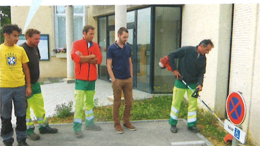
▲ Formation des employés municipaux ▼ Enherbement zone 3

L'espace prend forme, les travaux de terrassement ont démarré début septembre. La création de la mare, l'implantation de la boucle de circulation pour les personnes à mobilité réduite ont suivi. Après l'engazonnement du verger, les plantations des arbres fruitiers seront réalisées par les apprentis du Centre de formation de Chateaufarine courant novembre. L'entretien du verger sera confié, par convention, à l'association Julienne JAVEL. Dans un deuxième temps, la liaison piétonne entre la rue Champêtre et la rue de la Combe du Puits sera bordée d'une haie d'arbustes. Lors des plantations, les enfants des classes élémentaires accompagneront les apprentis du CFPPA pour élaborer un cahier de suivi de l'évolution des arbres fruitiers. ■ Patricia Peltier