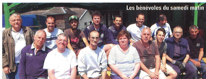
Les bénévoles du samedi matin

Une affluence record a été enregistrée à la kermesse, pour le week-end de la Pentecôte, sous un soleil radieux. Cette manifestation intergénérationnelle rassemble les familles et habitants du village. La kermesse, organisée par toutes les associations du village, permet de récolter des fonds au profit de chacune de ces associations. Les nombreux bénévoles ont encore une fois été récompensés pour leur investissement. La soirée du samedi a été clôturée par le traditionnel feu d'artifice, offert par la municipalité, tandis que le tiercé de cochons du dimanche récompensait deux gagnants dans l'ordre, 14 dans le désordre et 37 pour le couplé.