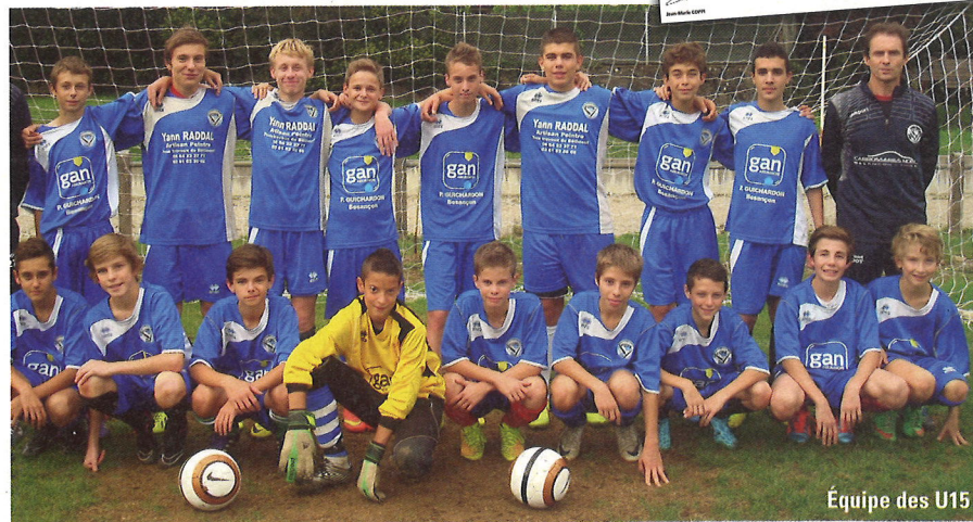
Équipe des U15